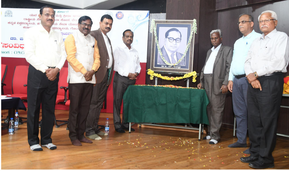
ಡಾ.ಬಿ.ಆರ್. ಅಂಬೇಡ್ಕರ್ ಅವರ ಭಾವಚಿತ್ರಕ್ಕೆ ಮಾನ್ಯ ಕುಲಪತಿಯವರು ಹಾಗೂ ಗಣ್ಯರು ಪುಷ್ಪ ಅರ್ಪಿಸಿದರು.

ಸಂವಿಧಾನದ ಮೂಲಕ ಜನಸಾಮಾನ್ಯರನ್ನು ಸಾಮಾಜಿಕ ಕಟ್ಟುಪಾಡುಗಳಿಂದ ವಿಮೂಕ್ತಿಗೊಳಿಸಿ ಜನರನ್ನು ಸ್ವತಂತ್ರವಾಗಿ ಜೀವಿಸಲು ಅವಕಾಶ ಕಲ್ಪಿಸಿದ್ದಾರೆ ಎಂದು ಹೇಳಿದರು. ಪ್ರಮುಖವಾಗಿ ಪ್ರಸ್ತುತ ದಿನಗಳಲ್ಲಿ ಜಾತಿ ಧರ್ಮಗಳು ಜನರ ದಿಕ್ಕನ್ನು ತಪ್ಪಿಸುತ್ತಿದ್ದು ಇದು ಬದಲಾಗಬೇಕಿದೆ. ಪ್ರಜಾಪ್ರಭುತ್ವ ವ್ಯವಸ್ಥೆಯಲ್ಲಿ ಪ್ರಜೆಗಳೇ ಪ್ರಭುಗಳು. ಪವಿತ್ರವಾದ ಸಂವಿಧಾನದ ಮೂಲ ಆಶಯ ಸಮ ಸಮಾಜದ ನಿರ್ಮಾಣದ ದೂರ ದೃಷ್ಟಿಕೋನ ಹೊಂದಿದೆ. ಆದರೆ ಕೆಲ ಜನರು ಸಂವಿಧಾನವನ್ನು ತಿರಿಚುವ ಕೆಲಸವನ್ನು ಮಾಡುತ್ತಿದ್ದಾರೆ. ಇಂತಹ ಮನಸ್ಸುಗಳು ಬದಲಾಗಬೇಕು. ಪ್ರತಿಯೊಬ್ಬ ಜನಸಾಮಾನ್ಯರು ಸಂವಿಧಾನವನ್ನು ಸರಿಯಾದ ಕ್ರಮದಲ್ಲಿ ಓದಿ ಅರ್ಥೈಸಿಕೊಂಡು ಸರಿಯಾಗಿ ಪಾಲನೆ ಮಾಡಿದಾಗ ಸಂವಿಧಾನದ ಮಹತ್ವ ಹಾಗೂ ಡಾ. ಬಿ.ಆರ್.ಅಂಬೇಡ್ಕರ್ ಅವರ ದೃಷ್ಟಿಕೋನ ಅರ್ಥವಾಗುತ್ತದೆ ಎಂದು ತಿಳಿಸಿದರು. ಇದೇ ಸಂದರ್ಭದಲ್ಲಿ ಯಾವುದೇ ಆಸೆ ಆಕಾಂಕ್ಷೆಗಳಿಗೆ ಬಲಿಯಾಗದೆ ಅಂಬೇಡ್ಕರ್ ಅವರು ನೀಡಿದ ಮತದಾನದ ಹಕ್ಕನ್ನು ಮನಸ್ಸು ಶುದ್ಧವಾಗಿ ಇಟ್ಟುಕೊಂಡು ಆತ್ಮ ಸಾಕ್ಷಿಯಾಗಿ ನಿಮ್ಮ ನಾಯಕರನ್ನು ಆಯ್ಕೆ ಮಾಡಿಕೊಂಡಾಗ ಮಾತ್ರ ಉತ್ತಮ ಸಮಾಜ ನಿರ್ಮಾಣವಾಗುತ್ತದೆ ಎಂದು ವಿದ್ಯಾರ್ಥಿಗಳಿಗೆ ಕಿವಿಮಾತು ಹೇಳಿದರು.