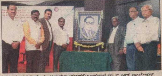
ಹಂಪಿ ಕನ್ನಡ ವಿವಿಯ ಮಂಟಪ ಸಭಾಂಗಣದಲ್ಲಿ ಬುಧವಾರ ಡಾ.ಬಿ.ಆರ್.ಅಂಬೇಡ್ಕರ್ ಪ್ರಚಾರ ಅಭಿಯಾನದ ಸಂವಿಧಾನ ಓದು ಕಾರ್ಯಾಗಾರ ನಡೆಯಿತು.