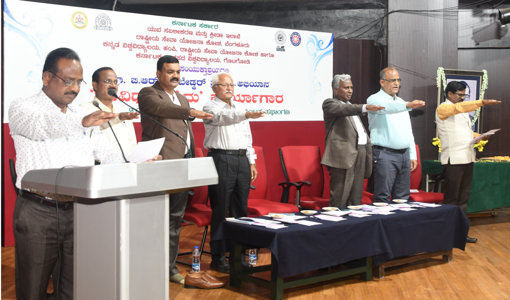
ಸಂವಿಧಾನದ ಪ್ರಸ್ತಾವನೆಯ ಪ್ರತಿಜ್ಞಾವಿಧಿ ಸ್ವೀಕಾರ